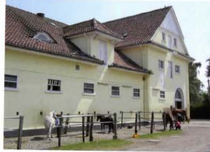
Großen Wert legt der RVH auf seine Jugendarbeit.

Der Reiterverein Hannover blickt auf eine langjährige Tradition zurück. Auf dem Gelände der ehemaligen Kavallerieschule war der jetzige Reiterverein Hannover Stall und Trainingsanlage geschichtlich bedeutsamer und auch sehr erfolgreicher Reiter wie zum Beispiel Graf von Stauffenberg. Zahlreiche Turniere und Veranstaltungen finden jedes Jahr auf dem Gelände des RVH statt, so zum Beispiel als eigene Turniere das Military Meeting im März, die Regions- und Bezirksmeisterschaften im Mai, ein Dressurturnier im August sowie ein Pony- und Jugendturnier im September. Besonders stolz sind Vorstand und Mitglieder, dass das Hannoverische Landesturnier HA.LT wie auch das Trakehner Bundesturnier im Reiterverein Hannover ausgetragen werden.