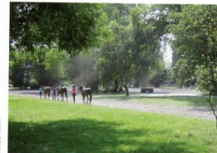
Wie eine grüne Oase liegt die Anlage mitten in der Landeshauptstadt.